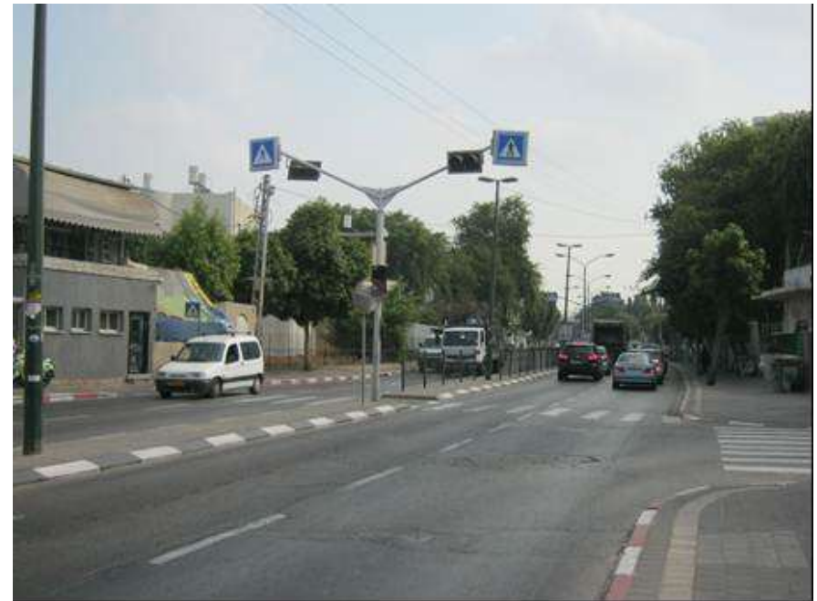
(5) תל-אביב, רח' לח"י 11