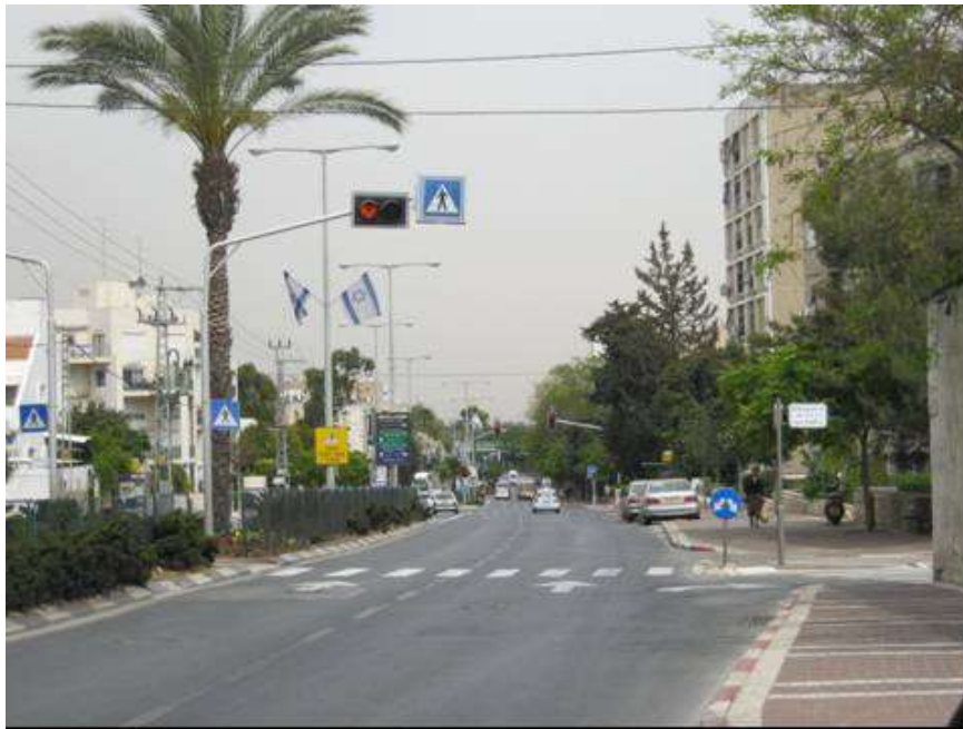
(6) תל-אביב, רח' חיים ברלב 33

אתרי ביקורת לאתר טיפול בתל-אביב: מעברי חצייה מסומנים בקטע דרך עם מפרדה רציפה, עם פעילות הולכי רגל. מ"מ 50 קמ"ש, עם מעקות מפרדה. אתרי הביקורת נבחרו בתל-אביב , באותו עורק תנועת