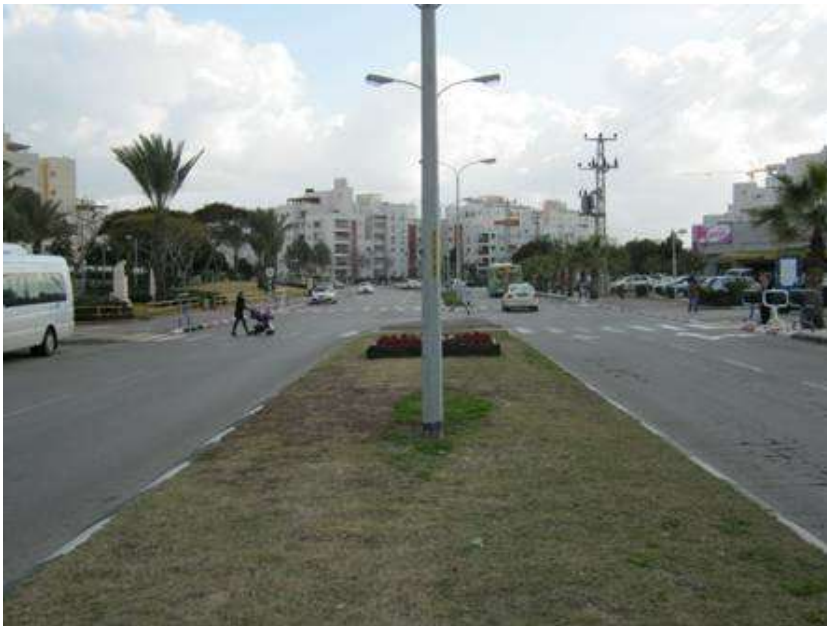
(3) אשדוד, רח' דוד המלך, מעבר חציה מול מרכז מסחרי

אתרי ביקורת לאתר טיפול בבאר-שבע: מעברי חצייה מסומנים בקטע דרך עם מפרדה רציפה, עם פעילות הולכי רגל. מ"מ 50 קמ"ש, ללא מיתון תנועה. עקב מחיקה גורפת של מעברי חציה לא מרומזרים בכל העיר באר שבע, אתרי הביקורת נבחרו באשדוד.