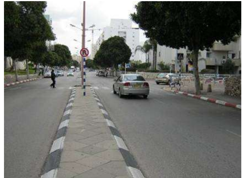
(2) אשדוד, רח' יהודה הלוי פינת ביאליק, ליד קניון